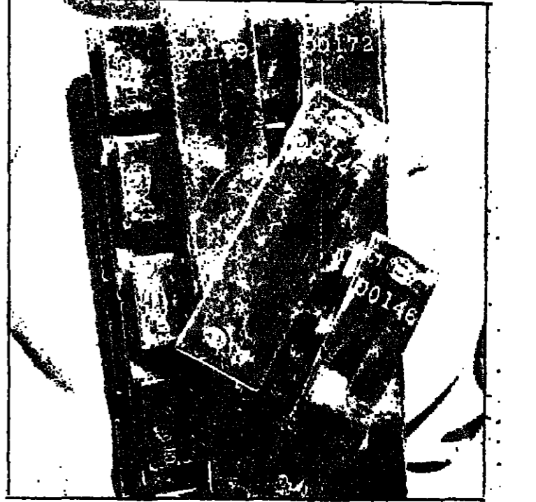
سبائك ذهبية .. تتنقل من قارة الى اخرى ومن مصرف الى آخر .

سعر اونصة الذهب هو الان تسعون الف دولار . ما بين ايار (مايو) ونهاية شهر اكتوبر من هذا الحال من الذهب هو النتيجة الوحيدة لجساره الخرب . بالدرجة الثانية فان التقلبات السياسية في العالم تؤثر على السعر . في نهاية العام الماضي كان احتياض الدولتين الامريكيتين رهائن في طهران سببا لارتفاع السعر ثم جاء الاجتياح العسكري السوفياتي لافغانستان ليؤثر تارا جديدة للهبالسعر في الغالب ، كان الشارون يتمون للسعر في اسيا والمحيطه بايران وافغانستان اشقة الى افراد من شمسي هذين البلدين الخوف من التقلبات السياسية والتهديدات الاقتصادية والتقلبات هو الدافع الجوهري الى مثل تلك التصرفات .